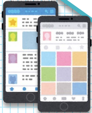
インターネットに 詳しいふじ君

誹謗中傷などで悩んでいる、 またSNSなどをよく利用される方は、 一度目を通されることを おすすめします！